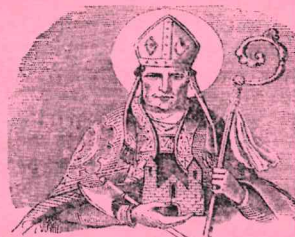
Hl. Wolfgang, Patron der Diözese Regensburg, bitte für